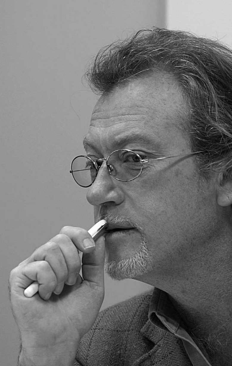
Anderson en el taller de perfiles.