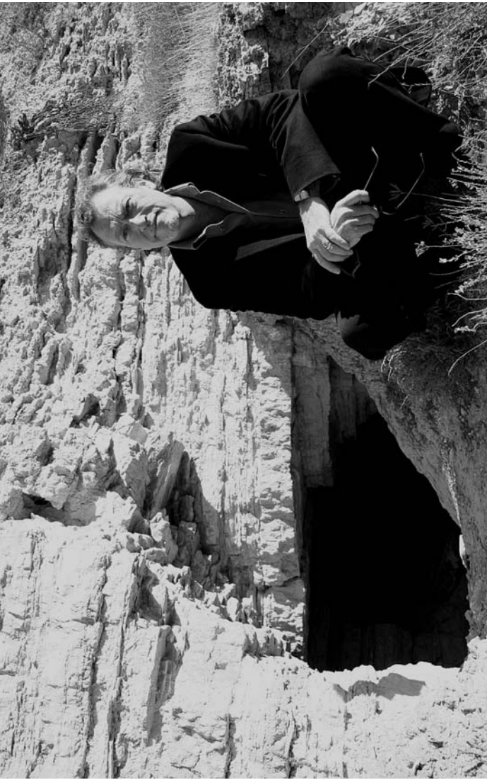
Jon Lee Anderson en la Sierra de Alcubierre.