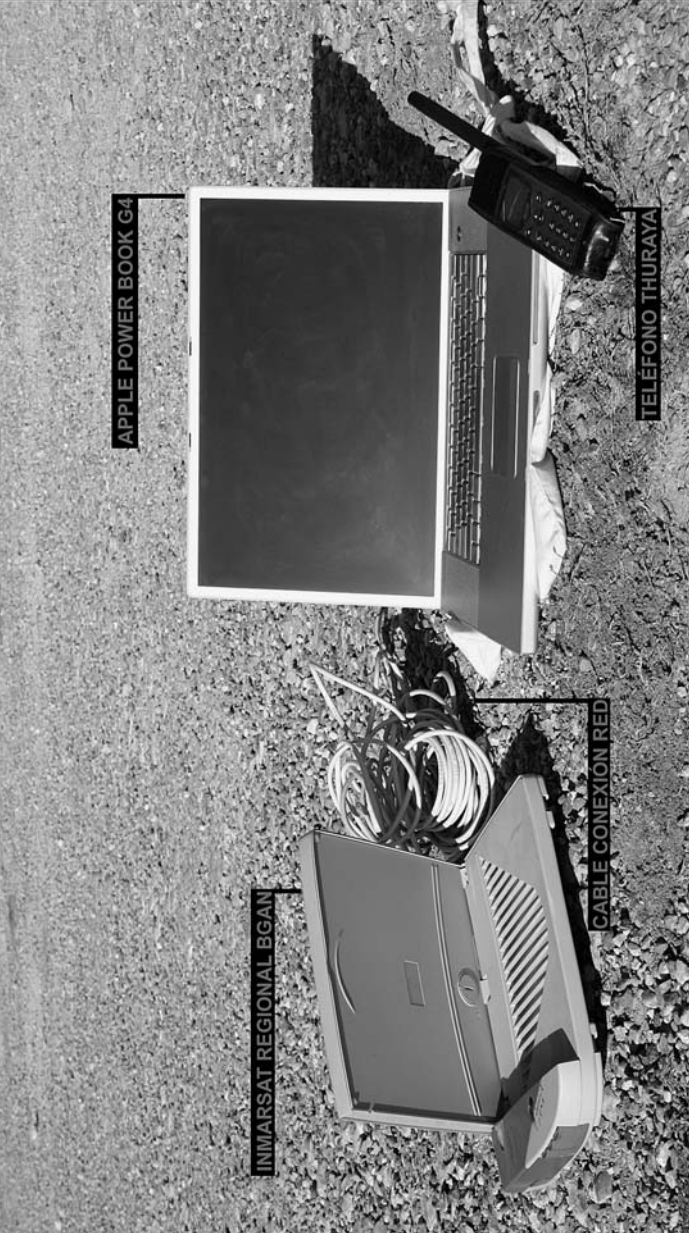
El equipo de Anderson.